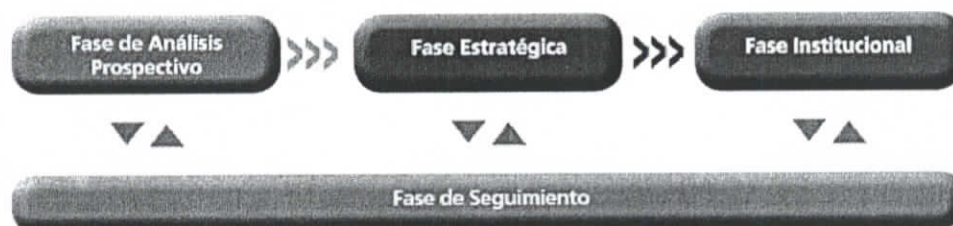
GRAFICO N° 01: FASES DEL PROCESO DE PLANEAMIENTO ESTRATEGICO

Los Gobiernos Regionales se encargan de la redacción del PDRC en la Fase Estratégica, utilizando la información generada en su Fase de Análisis Prospectivo, así como la información provista por los sectores en su proceso de planeamiento estratégico, respecto a sus competencias compartidas.