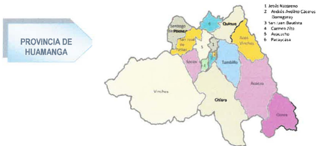
Distritos de la provincia de Huamanga