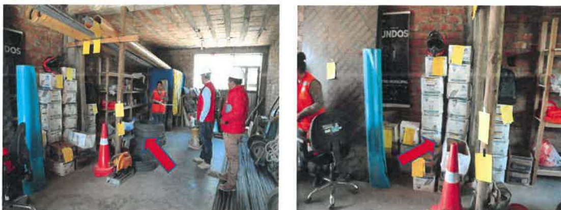
Registro fotográfico N° 17 y 18

Almacén de obra no cumple con las condiciones mínimas que permitan una adecuada conservación, custodia y control de bienes y materiales; lo que afectaría en su calidad, deterior de bienes y su vida útil y un saldo de existencias oportuno. Se encuentra desordenado. Así mismo se pudo evidenciar bienes almacenados sobre el suelo tal como se muestra en el registro fotográfico 17 y 18.