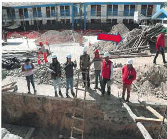
Registro fotográfico N° 9 y 10

De la fiscalización se evidencia material excedente de movimiento de tierras, conjuntamente con puntales de madera almacenados inadecuadamente a la altura de módulo 02 de nivel secundario. Falta realizar orden y limpieza.