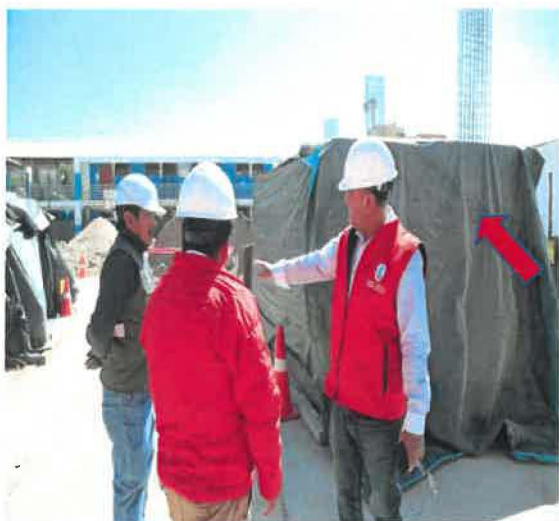
Registro fotográfico N° 15 y 16

Se evidenció 560 bolsas de cemento apiladas a la intemperie, cubiertas material de plástico, sin las condiciones adecuadas de almacenamiento como: mantener el material bajo techo, utilizar elementos de madera como pallets o parihuelas para evitar el contacto con el suelo, evitar apilamiento de más de 10 bolsas; asimismo, lo cual, sumado a las inadecuadas condiciones de almacenamiento, constituye el riesgo de reducir la calidad del material y acelerar su deterioro, conforme se muestra a continuación inadecuado almacenamiento de bolsas de cemento, acelera su deterioro y genera el riesgo en la calidad del material, afectando la resistencia y durabilidad de la obra. Tal como se muestra en los registros fotográficos.