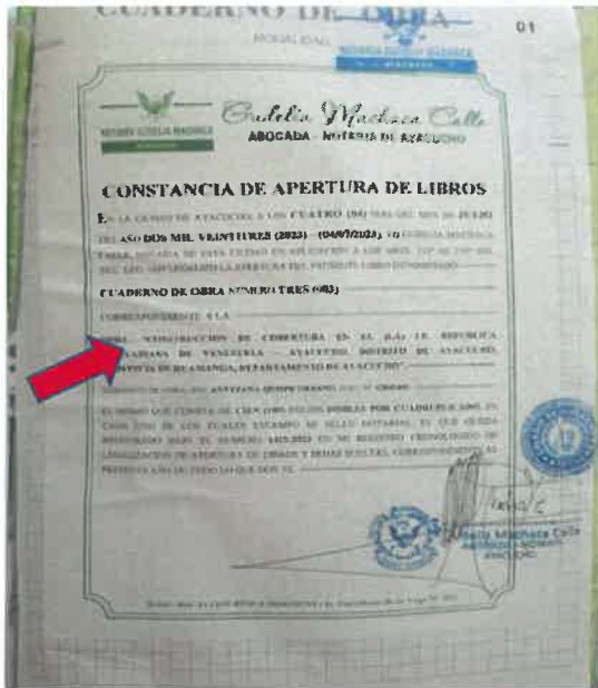
Registro fotográfico N° 1 y 2

Se evidencio la apertura de un nuevo cuaderno de obra N°03, proyecto "Construcción de Cobertura; en la IE República Bolivariana de Venezuela - Ayacucho Distrito de Ayacucho, Provincia Huamanga, Departamento Ayacucho con fecha 4 de julio del año 2023. No obstante, se tiene un plazo programado según Expediente Técnico con fecha de inicio de obra el 21 de marzo de 2023. Y un plazo de ejecución programado de 90 días calendarios. Tampoco, se tiene información con relación del corte de obra, valorizaciones, cuadernos de obra desde su inicio. De acuerdo a registro fotográfico 1 y 2.