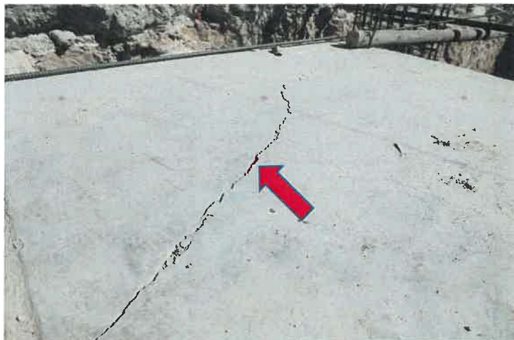
Registro fotográfico N° 6 Grieta en Losa de concreto

Se evidencia grietas en losa de concreto simple como consecuencia de la demolición realizada en el proceso de ejecución tales como: Corte en zapatas, demoliciones con maquinaria.