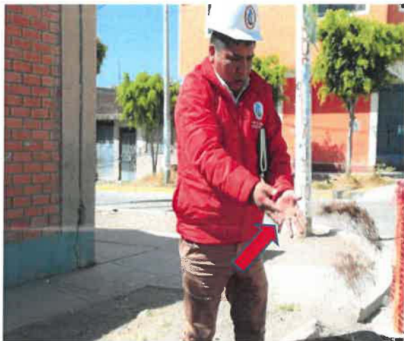
Registro fotográfico N° 13 y 14

GOBIERNO REGIONAL DE AYACUCHO CONSEJO REGIONAL DE AYACUCHO