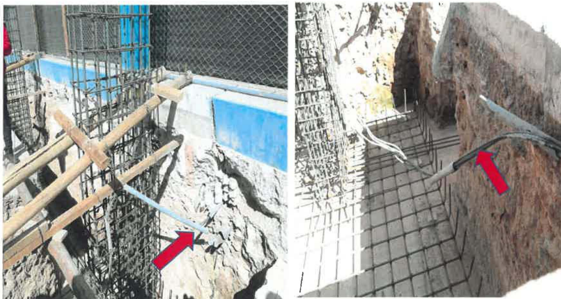
Registro fotográfico N° 7 y 8

Tuberías y cables dañados al realizar trabajos de excavación de zapatas y demoliciones con maquinarias, altura de modulo 2 de nivel primario.