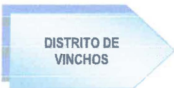
Mapa N° 2: Ubicación a Nivel distrital