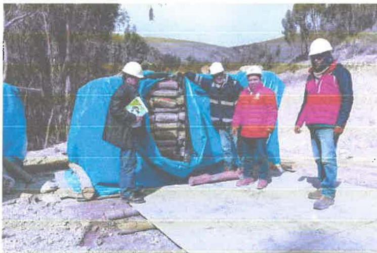
Apilamiento de cemento portland tipo I en un lugar sin techado