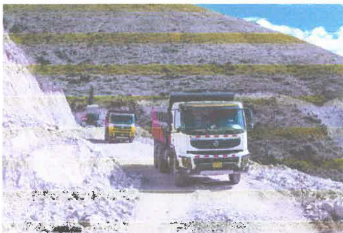
Fuente: inspección física y fiscalización de 10 de mayo de 2023. Elaborado por: Comisión de Fiscalización.

Servicio de alquiler de 02 volquetes 15m3 para 1700 HM.