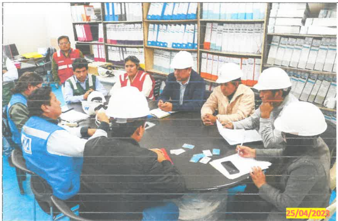
IMG. 01.- La comisión dirigida por el señor consejero regional Héctor Alberto Cárdenas Castro, inicia con el proceso de fiscalización de la obra: "MEJORAMIENTO DE LA CAPACIDAD RESOLUTIVA DE LAS UNIDADES PRODUCTORAS DEL HOSPITAL DE CANGALLO, SEGUNDO NIVEL DE ATENCION PROVINCIA CANGALLO REGION AYACUCHO". Visita inopinada realizado el día 24 de abril del 2023.

GOBIERNO REGIONAL DE AYACUCHO CONSEJO REGIONAL DE AYACUCHO