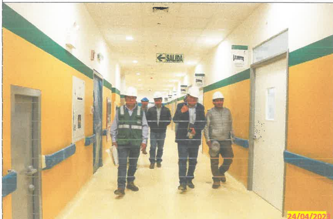
IMG. 02.- Visita a los diferentes ambientes de la construcción guiados por el residente de la obra que están en los trabajos de acabados finales.