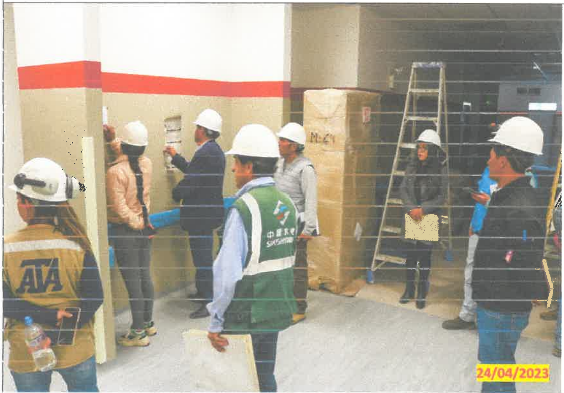
IMG. 06.- Verificando las válvulas de control de la casa de maquinas