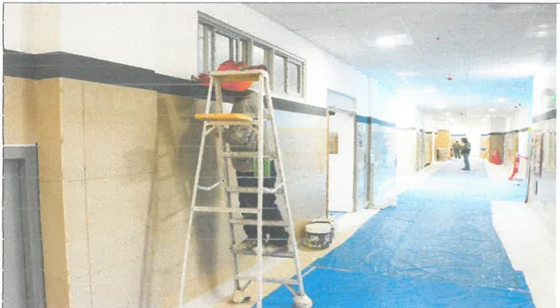
IMG. 03.- Se aprecia los trabajos realizados en los acabados y pintura en los diferentes ambientes de la construcción.

GOBIERNO REGIONAL DE AYACUCHO CONSEJO REGIONAL DE AYACUCHO