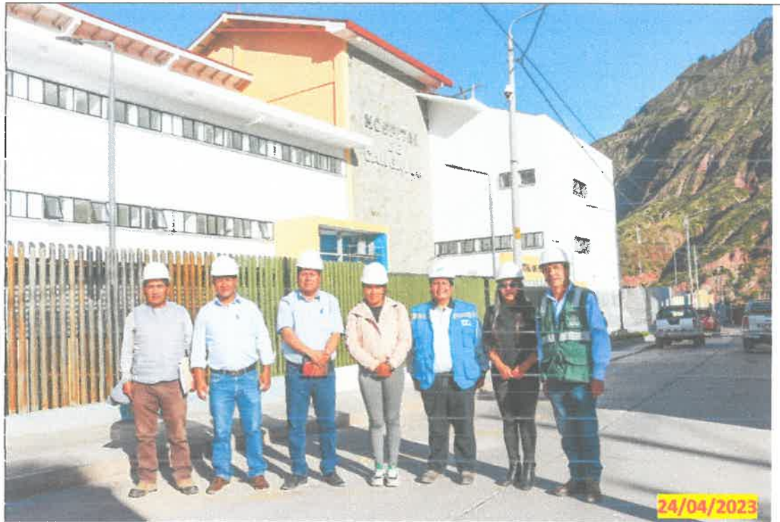
IMG. 08.- Frontis de la construcción conjuntamente con los responsables de la ejecución.