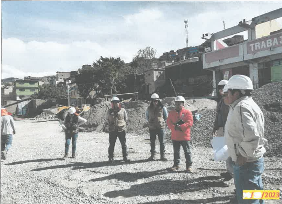
IMG. 08.- Se evidencia el control del personal técnico en la obra y la sociabilización para la correcta ejecución de la obra.