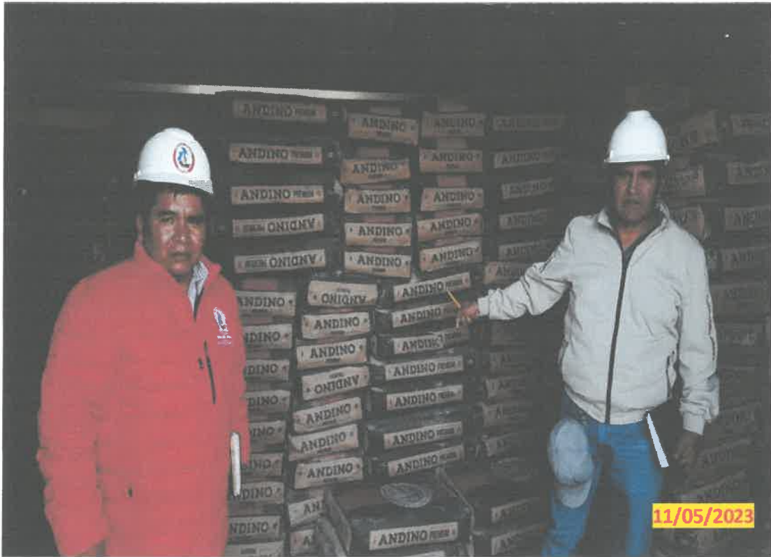
IMG. 05.- Vista de la verificación del almacenamiento del cemento portland tipo I en la obra.