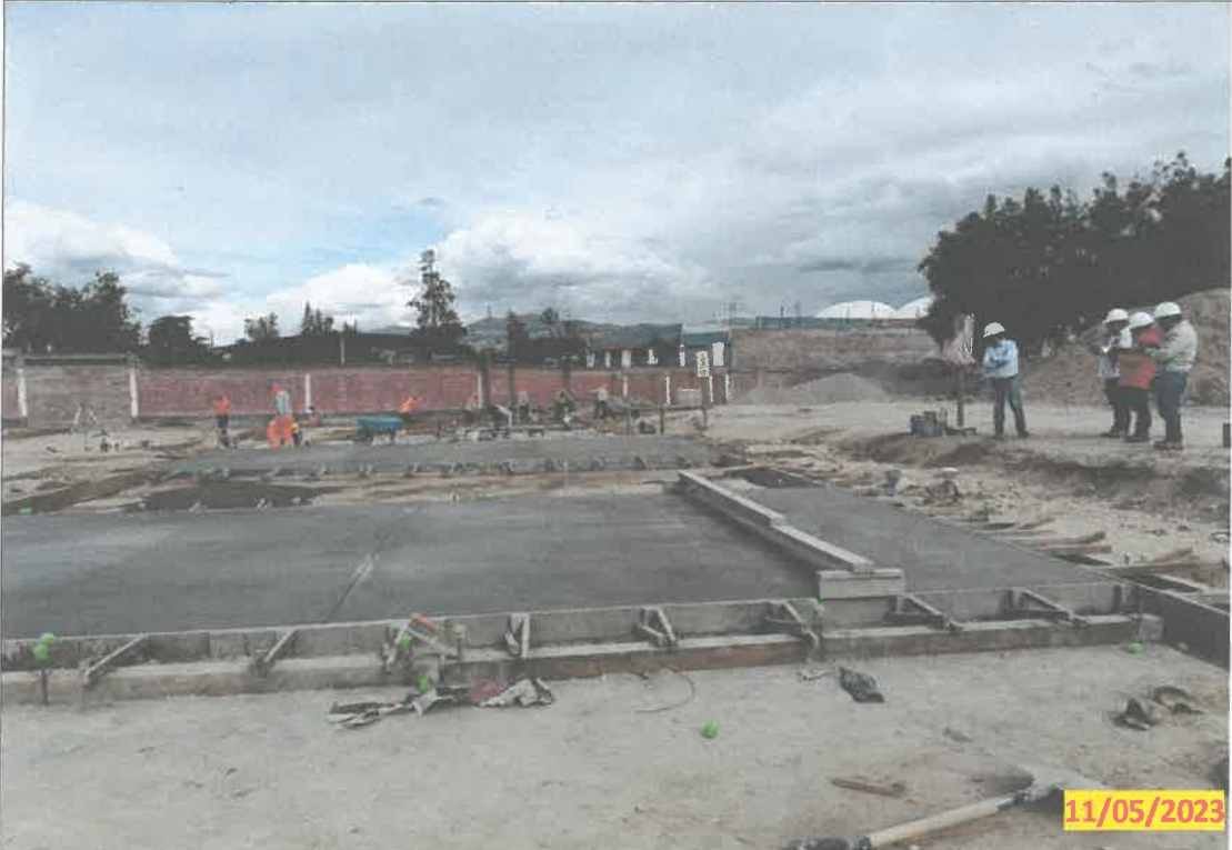
IMG. 04.- Se aprecia la construcción de módulos de contingencia para poder trasladar a los alumnos a las aulas prefabricadas y acelerar con la ejecución de los módulos que aún están ocupando los estudiantes hasta la fecha.