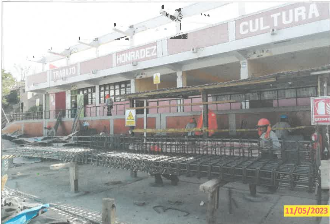
IMG. 03.- Al fondo se aprecia la infraestructura educativa para demoler, pero hasta la fecha no se puede demoler a falta de maquinaria y equipo necesario.