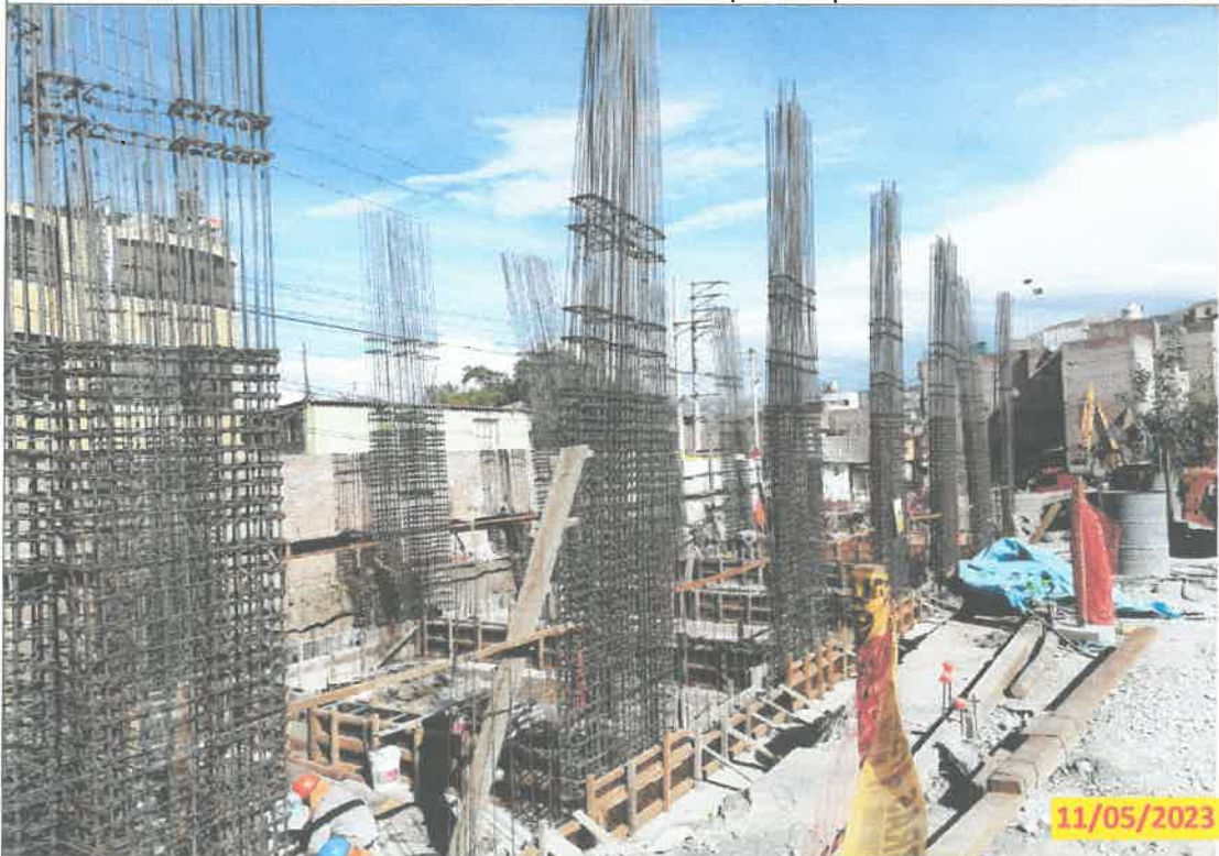
IMG. 06.- Se evidencia el encofrado de las vigas de cimentación en el modulo 6 de la obra