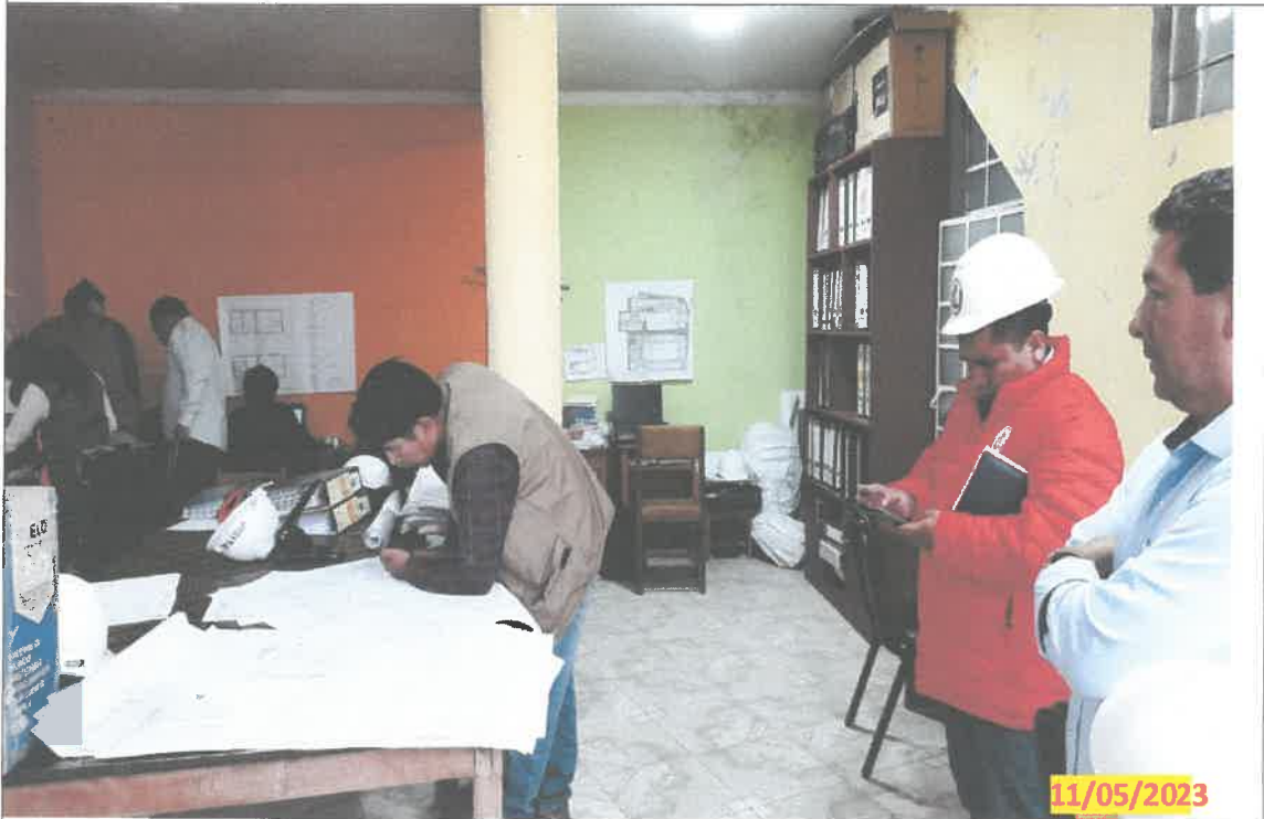
IMG. 02.- Revisión de los documentos exigidos en la ejecución de la obra por la modalidad de administración directa.