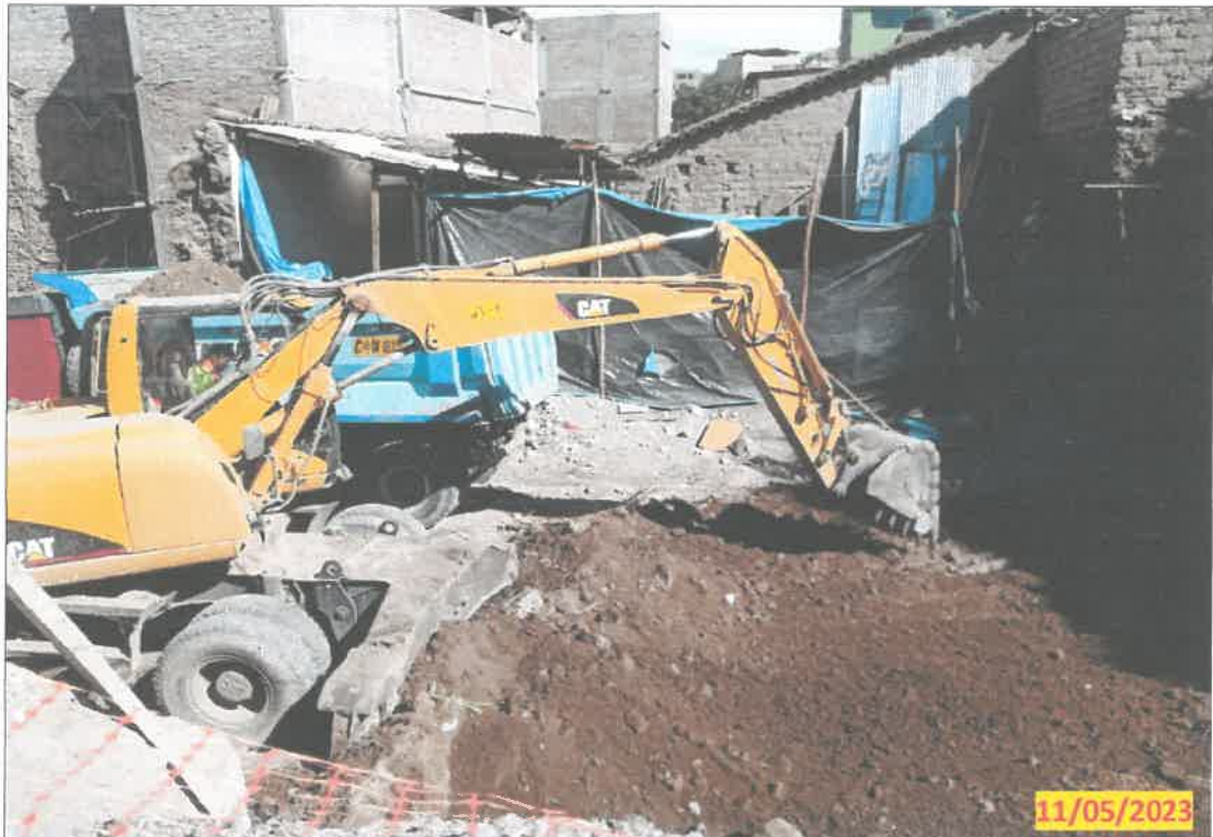
IMG. 07.- Se evidencia el movimiento de tierra que esta realizando para la construcción de un nuevo modulo de construcción.