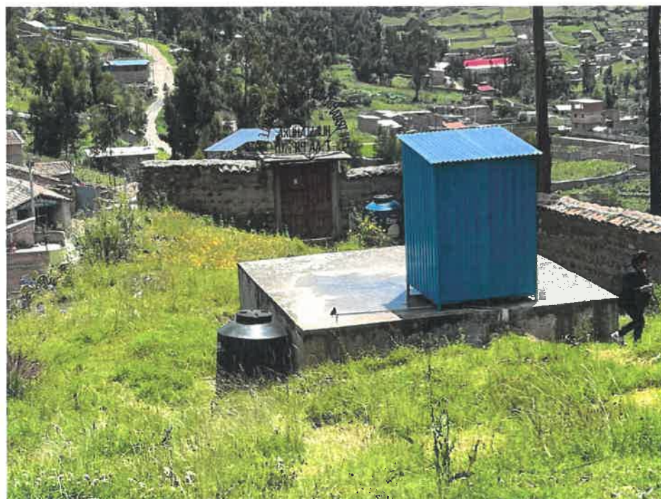
Caseta de cloración y tapa del reservorio del sistema de tratamiento de agua (filtración y Reservorio) del centro poblado de Huasachura.