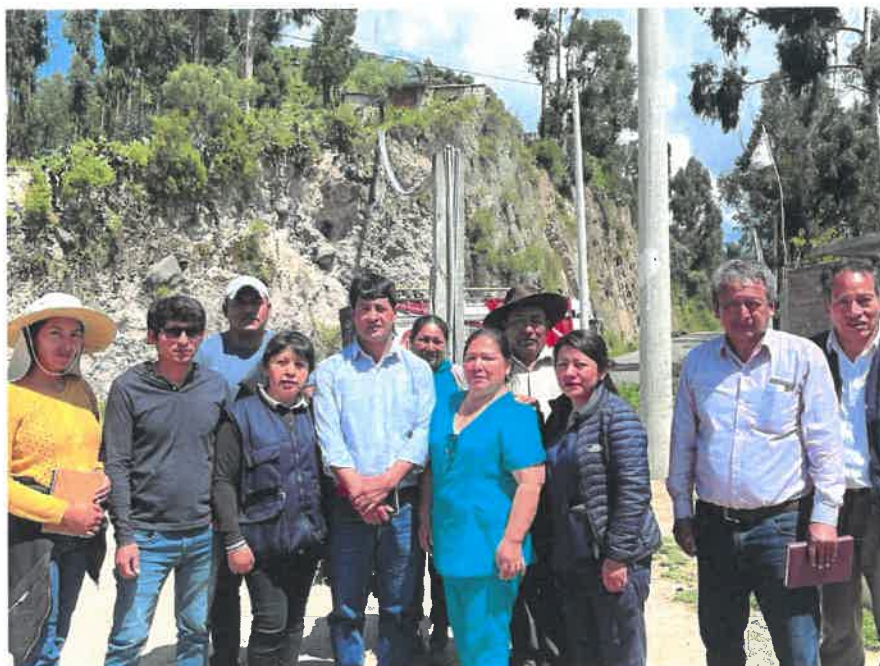
Personas que participaron en la visita de campo al sistema de tratamiento de agua (filtración y Reservorio) del centro poblado de Huaschahura.