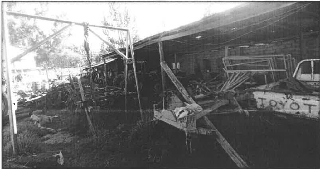
Imágenes N°s 17, 18 y 19 Unidades vehiculares en condición de chatarra

La Comisión Agraria Permanente, como resultado de la verificación realizada el 26 de abril de 2023 a la Agencia Agraria Parinacochas, ha evidenciado la existencia de unidades vehiculares en condición de inoperatividad y en estado de chatarra entre vehículos menores (motos lineales), camionetas y otros, en el patio de la referida Agencia; así como, equipos de cómputo en el almacén, los cuáles en su mayoría no tiene placas, se encuentran sin llantas, con material oxidados, falta de piezas; entre otros, conforme se observan en las siguientes imágenes: