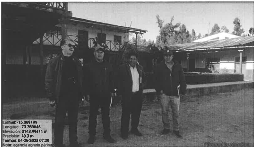
Imagen N° 0 1